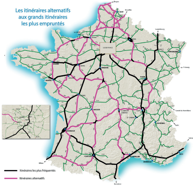
Les itinéraires alternatifs aux grands itinéraires les plus empruntés