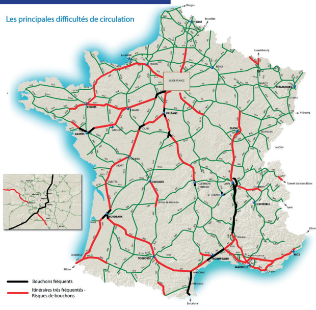
Les principales difficultés de circulation